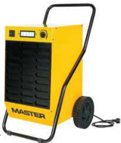
DH 44 DH 62 DH 92